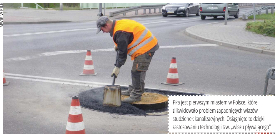
Piła jest pierwszym miastem w Polsce, które zlikwidowało problem zapadniętych włazów studzienek kanalizacyjnych. Osiągnięto to dzięki zastosowaniu technologii tzw. „włazu pływającego”

Proces zbiorowego zaopatrzenia w wodę rozpoczyna się od czerpania wody podziemnej, którą należy oczyścić. Dzięki zaawansowanym technologiom uzdatniania wody, parametry dostarczanej kranówki są zgodne z surowymi normami obowiązującymi w całej Europie. Potwierdzają to badania laboratoryjne wykonywane przez akredytowane laboratorium.