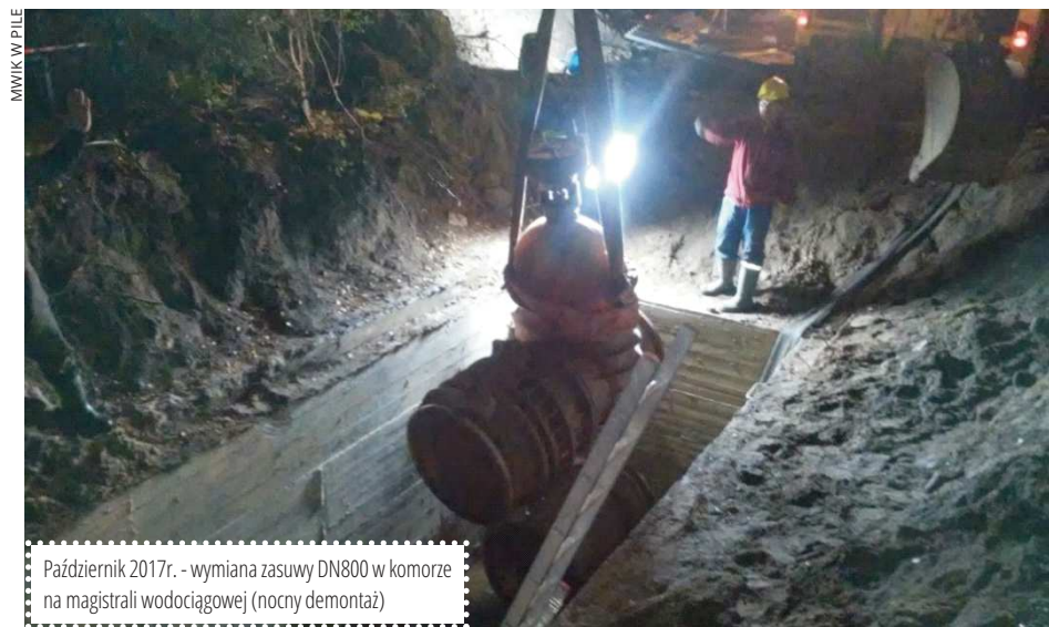
Październik 2017r. - wymiana zasuw DN800 w komorze na magistrali wodociągowej (nocny demontaż)

Aby wspomagać zarządzanie tak rozbudowanego systemu dystrybucji wody, konieczne jest prowadzenie stałego podglądu pracy sieci poprzez jej monitoring. Działające w jego ramach komory pomiarowe dostarczają pracownikom bieżących informacji o najważniejszych parametrach hydraulicznych sieci, czyli o ciśnieniu, prędkości i kierunku przepływu wody. W trosce o najwyższą jakość pilskiej kranówki, dostarczanej codziennie ponad 75 tysiącom mieszkańców pilskiej aglomeracji, równie istotne jest dla nas dbanie o stan przewodów wodociągowych.