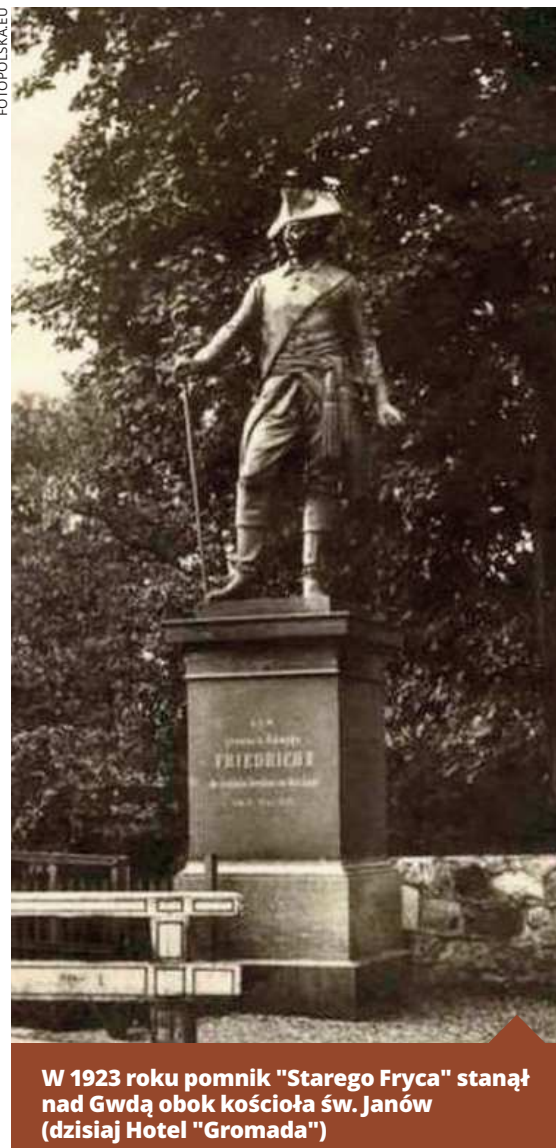
W 1923 roku pomnik „Starego Fryca” stanął nad Gwdą obok kościoła św. Janów (dzisiaj Hotel „Gromada”)