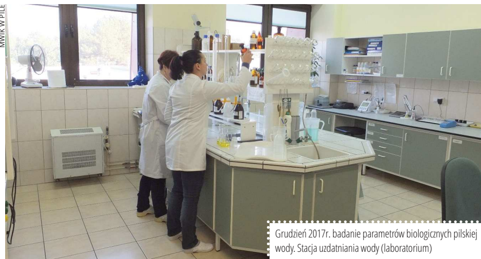
Grudzień 2017r. badanie parametrów biologicznych pilskiej wody. Stacja uzdatniania wody (laboratorium)

Aktualne badania dotyczące jakości wody można sprawdzić na stronie internetowej www.mwik.pila.pl