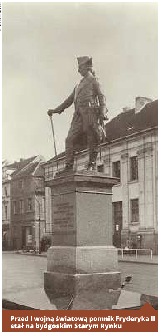
Przed I wojną światową pomnik Fryderyka II stał na bydgoskim Starym Rynku