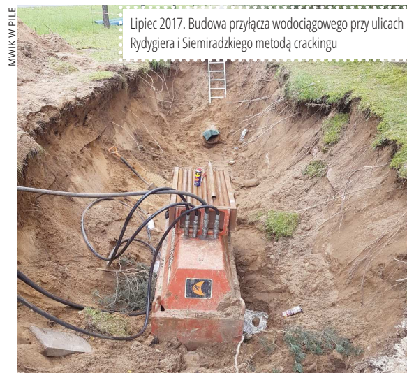
Lipiec 2017. Budowa przyłącza wodociągowego przy ulicach Rydygiera i Siemiradzkiego metodą crackingu

W związku z tym systematycznie prowadzona jest renowacja sieci. Dzięki bezwykopowej technologii „crackingu” wymiana przewodów wodociągowych wykonywana jest szybciej niż tradycyjnymi metodami, skutecznie ograniczając uciążliwości związane z pracami ziemnymi. Ważne jest również to, że metoda ta pozwala ograniczyć koszty związane z odtwarzaniem nawierzchni drogowej.