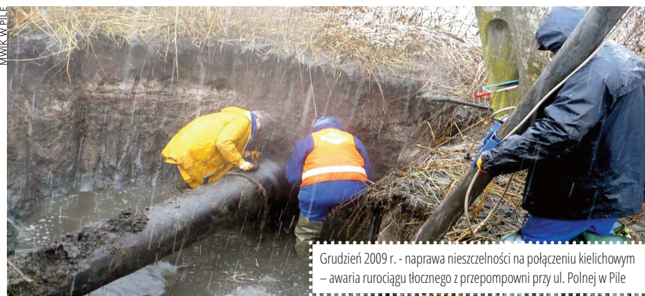
Grudzień 2009 r. - naprawa nieszczelności na połączeniu kielichowym - awaria rurociągu tłoczego z przepompowni przy ul. Polnej w Pile

W celu zapewnienia ciągłości odbioru ścieków, wszystkie awarie związane z zarwaniem lub niedrożnością systemu kanalizacyjnego usuwane są na bieżąco.