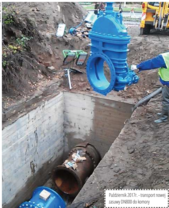
Październik 2017r. - transport nowej zasuw DN800 do komory