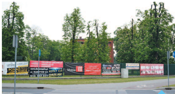
Obwieszonych reklamami płotów w Pile nie brakuje. Pilanie chcą zakazu takiego „ozdabiania” ogrodzeń

Tereniem, na którym najczęściej występują reklamy według opinii respondentów, jest Śródmieście, na drugim miejscu plasują się osiedla Podlasie i Zamość, dalej osiedla Górne i Staszycze. Za wprowadzeniem dodatkowej opłaty rekla-