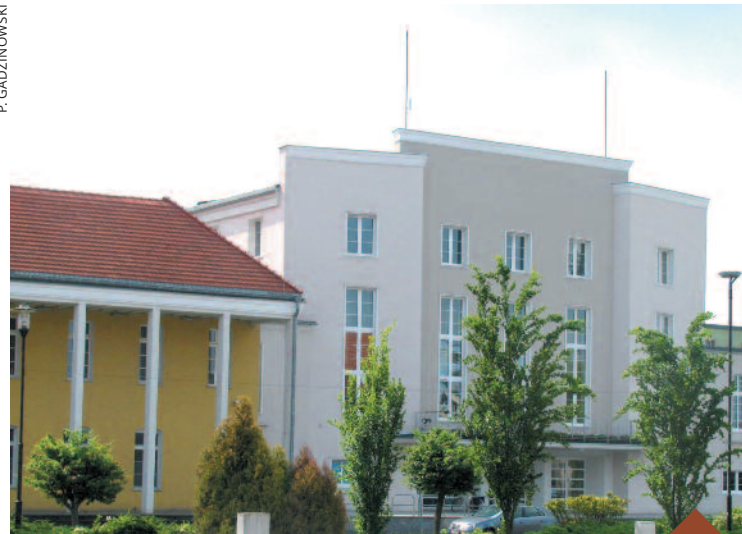
Regionalne Centrum Kultury „Fabryka Emocji”, przed II wojną światową mieściło się tu Muzeum Krajowe w Pile