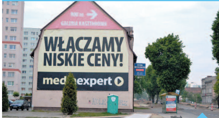
Pilanie chcą również ograniczenia reklam na elewacjach

mowej z tytułu lokalizacji tablic reklamowych i urządzeń reklamowych jest prawie 54 procent respondentów.