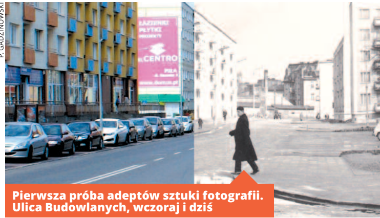
Pierwsza próba adeptów sztuki fotografii. Ulica Budowlanych, wczoraj i dziś