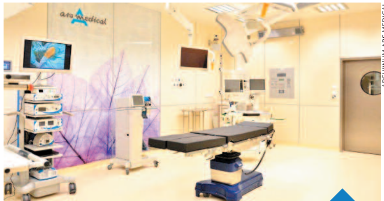
Ogólnochirurgiczną salę operacyjną wyposażono w aparaturę medyczną najnowszej generacji