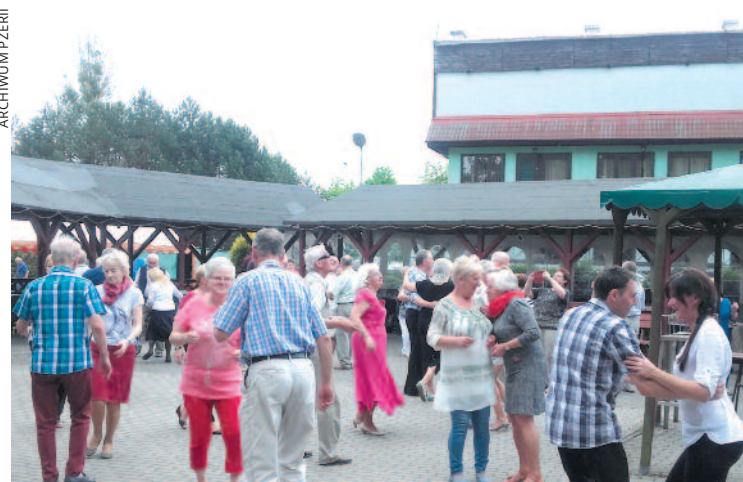
Piłscy seniorzy mają dużo energii do pomocy i zabawy

150 osób uczestniczyło w majowym pikniku integracyjnym Polskiego Związku Emerytów, Rencistów i Inwalidów w Pile, który odbył się na terenie Zjazdu „Tarcza”.