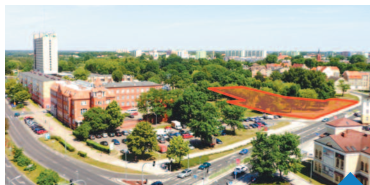
Miasto długo zabiegało o sprzedaż tego gruntu. Teraz czekamy, aż inwestor przedstawi koncepcję zagospodarowania tego terenu. A mogą tu powstać: mieszkania, hotel oraz lokale handlowe i usługowe

Miasto sprzedało działkę w rejonie ulic Piłsudskiego i Konopnickiej. W ciągu czterech lat powstać mają tam budynki, w których mogą znaleźć się mieszkania oraz lokale usługowe i handlowe.