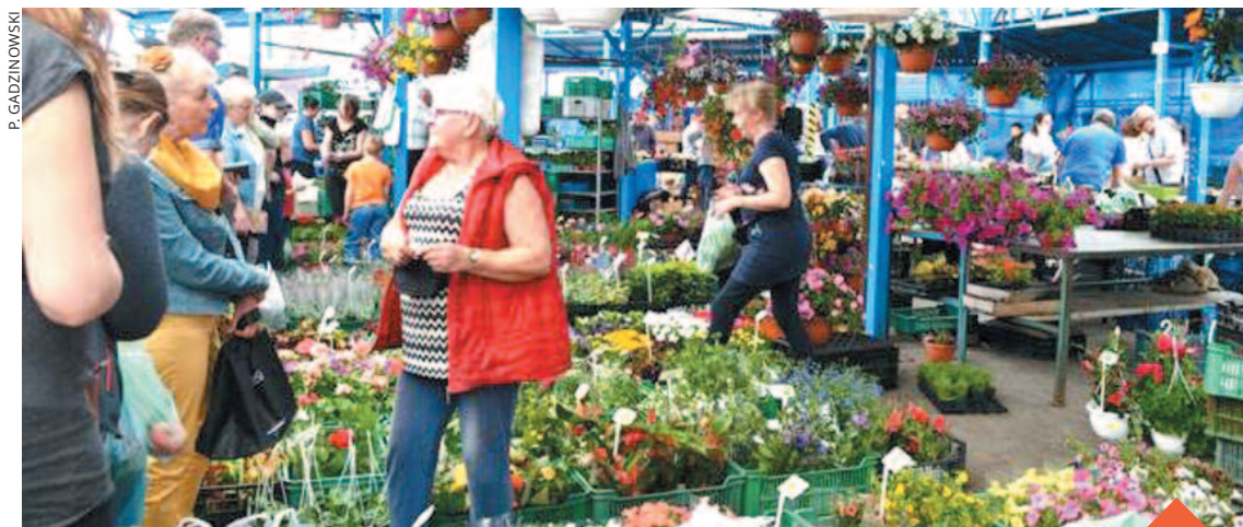
Stoiska z kwiatami cieszyły się dużym zainteresowaniem uczestników festiwalu

Spółka Tarpil zorganizowała na Targowisku Miejskim imprezę pod nazwą „Festiwal Kwiatów – Wiosna 2016 r.”. Było to pierwsze takie wydarzenie organizowane przez tę miejską spółkę.