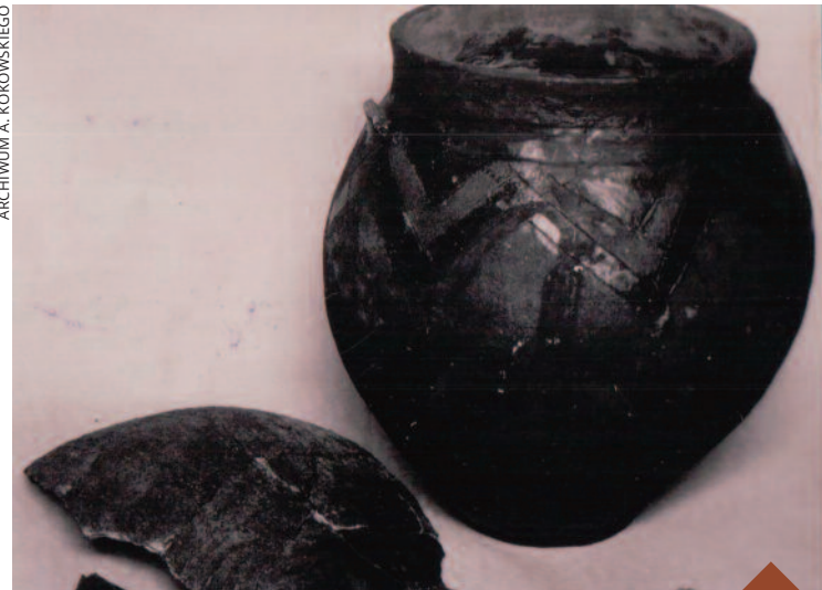
Po wojnie w ruinach muzeum odnaleziono zaledwie ułamek przebogatych zbiorów