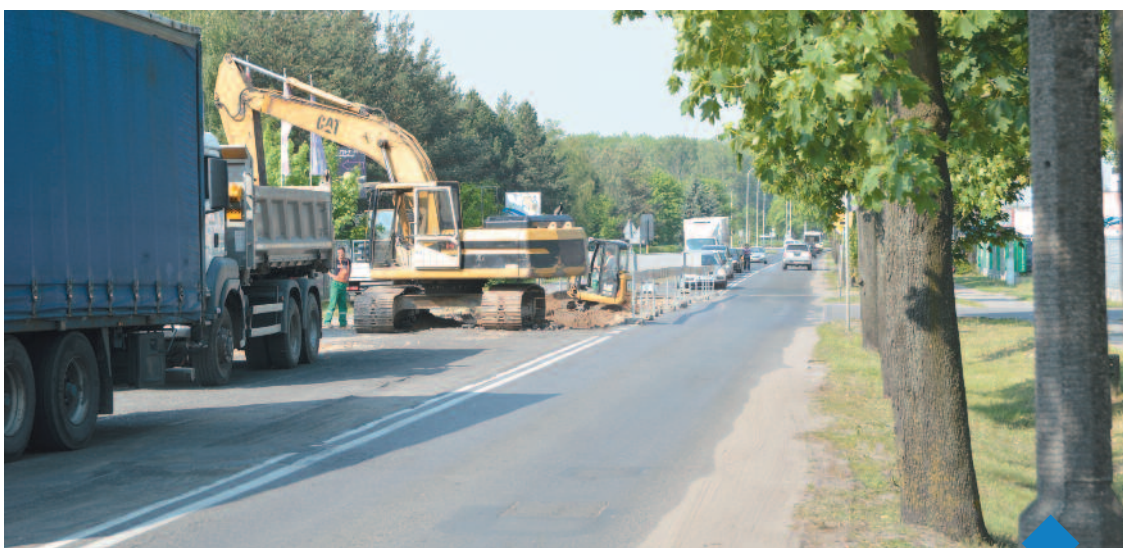
Budowa kanalizacji burzowej spowoduje, że okoliczne posesje i budynki nie będą już zalewane i podtapiane

Na ulicy Kossaka rozpoczął się IV etap budowy sieci kanalizacji deszczowej. Prace obejmują odcinek długości 700 metrów, od zjazdu do Aquaparku do pętli autobusowej przy Philipsie. Inwestycja powinna się zakończyć do 31 sierpnia.