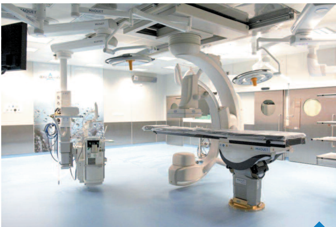
W hybrydowej sali operacyjnej można przeprowadzać najbardziej skomplikowane operacje z jednoczesnymi zabiegami na sercu