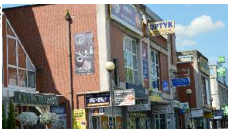
FOT. UM PIŁY

- Myślę, że jest to bardzo oczekiwana uchwała, której wprowadzenie zmieni bardzo pozytywnie wygląd miasta. W tych miastach w Polsce, w których wprowadzono wcześniej tego typu rozwiązania, zmiany są olbrzymie, dostrzegalne i bardzo dobrze odbierane - ocenia prezydent Piotr Głowski i dodaje. - Jestem przekonany, że będziemy mogli cieszyć się wieloma przestrzeniami na terenie miasta, które uzyskają nowy, ładniejszy wygląd.