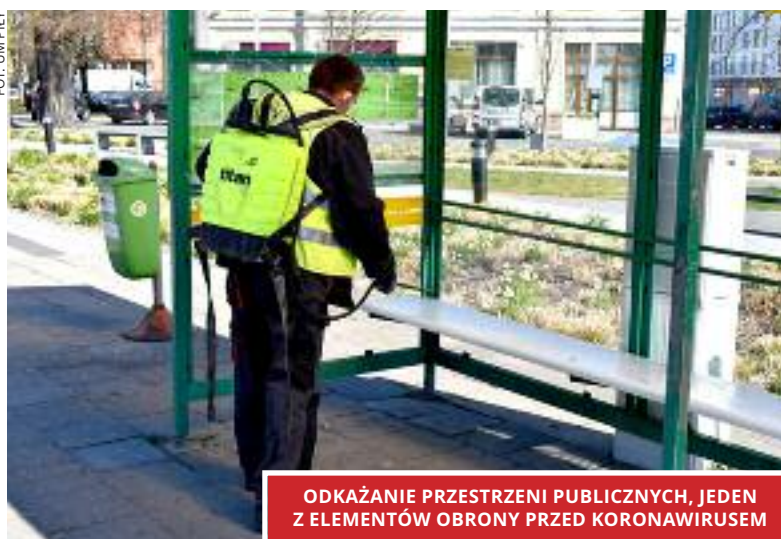
ODKAŻANIE PRZESTRZENI PUBLICZNYCH, JEDEN Z ELEMENTÓW OBRONY PRZED KORONAWIRUSEM

Czego w tej sytuacji powinni się spodziewać pilanie w drugiej połowie roku?