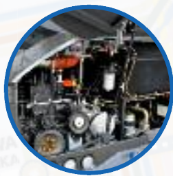
Cichy i ekologiczny silnik