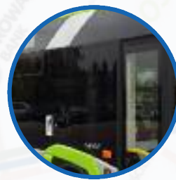
Duża liczba uchylnych okien, przyciemniane szyby, klimatyzacja