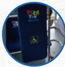
Szerokie drzwi, specjalne miejsca i komunikaty głosowe dla osób starszych i niepełnosprawnych