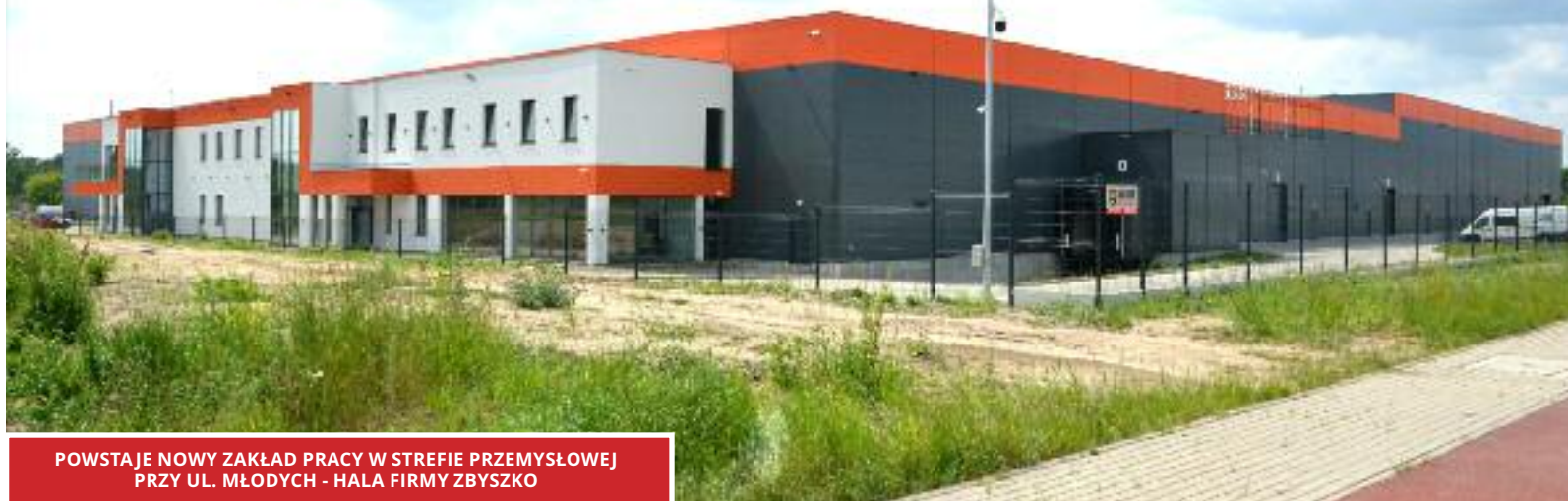
POWSTAJE NOWY ZAKŁAD PRACY W STREFIE PRZEMYSŁOWEJ PRZY UL. MŁODYCH - HALA FIRMY ZBYSZKO