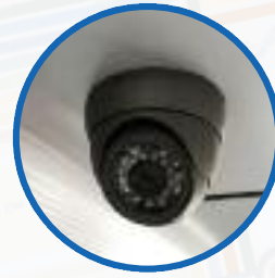
Pełny monitoring wizyjny - bezpieczeństwo pasażera