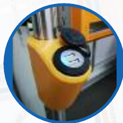
Gniazda USB umożliwiające ładowanie telefonu