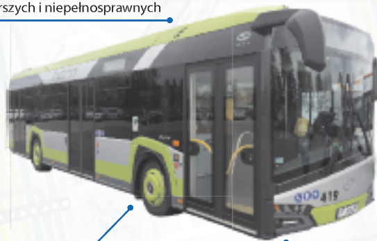
informacja o projekcie na www.pila.pl