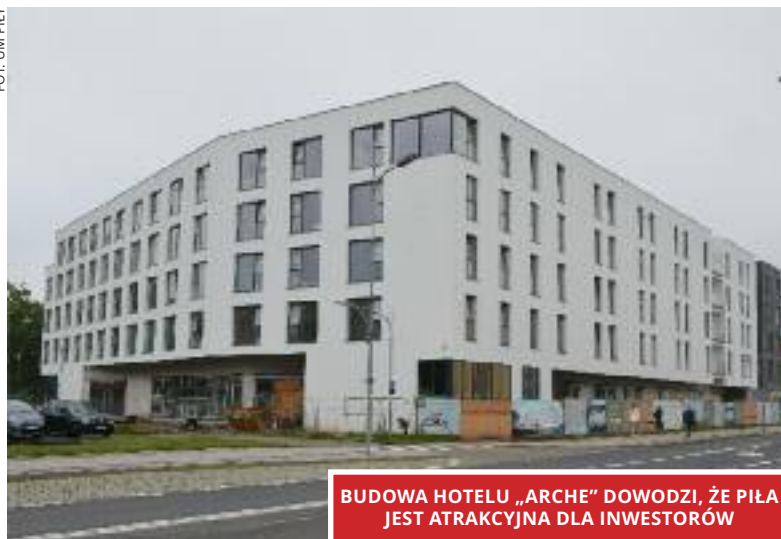
BUDOWA HOTELU „ARCHE” DOWODZI, ŻE PIŁA JEST ATRAKCYJNA DLA INWESTORÓW

- Sytuacja jest bardzo trudna, bo dochody budżetu tylko w kwietniu spadły o 40 procent. Tak jest w większości samorządów. Niestety, ze strony rządowej żadnego wsparcia nie otrzymujemy. Jedyną „pomocą” - cudzysłów jest nieprzypadkowy, jest umożliwienie - w stosunku do wcześniejszych planów - zaciągnięcie kredytu. Tak też uczyniliśmy, bo mamy nadzieję, że koniunktura w kolejnych latach pozwoli nam nadal inwestować i utrzymywać funkcjonowanie miasta na dotychczasowym, przyzwoitym poziomie, do jakiego przyzwyczaili się pilanie.