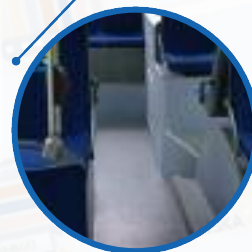
Nisko położona, antypoślizgowa podłoga