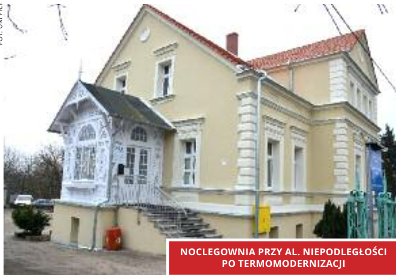
NOCLEGOWNIA PRZY AL. NIEPODLEGŁOŚCI PO TERMOMODERNIZACJI