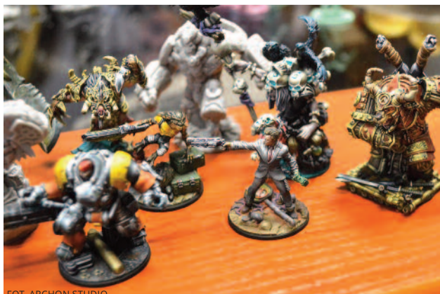
FOT. ARCHON STUDIO