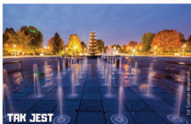
#ZmieniamyNaszeMiastoCodziennie ul. Park na Wyspie