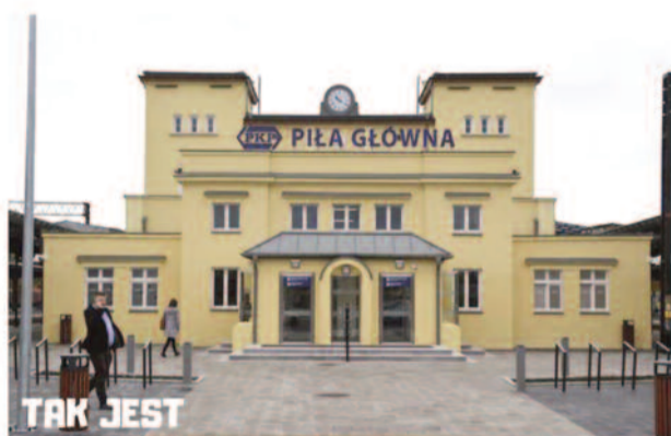
#ZmieniamyNaszeMiastoCodziennie Dworzec PKP