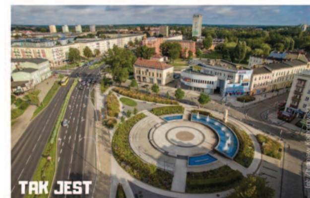
#ZmieniamyNaszeMiastoCodziennie pl. Konstytucji 3 Maja

Piła należy do nielicznych samorządów, które budują własne mieszkania. Ile udało się ich wybudować i czego spodziewać się mogą mieszkańcy Piły w najbliższej przyszłości?