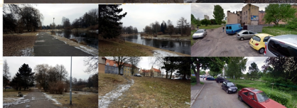
ANALIZA OBSZARU PROBLEMOWEGO