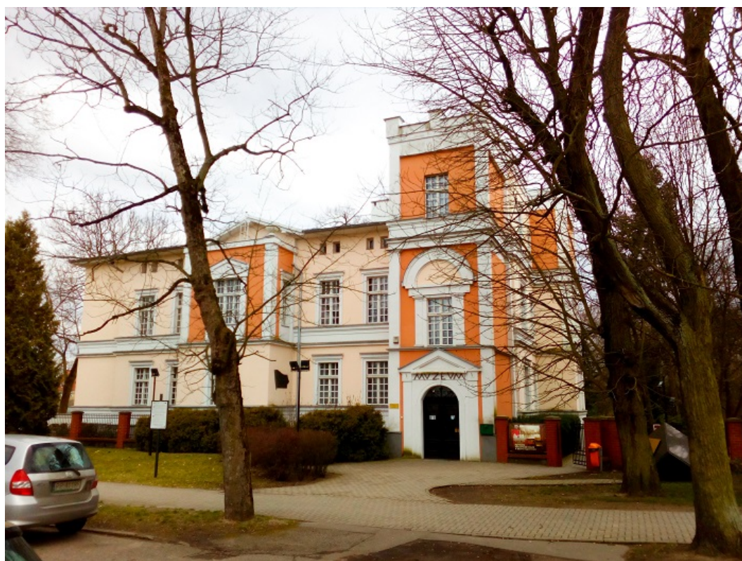
Dawny Konsulat RP. Obecnie Muzeum Okręgowe im. Stanisława Staszica w Pile

wojskowego. W późniejszych latach mieściła się w nim siedziba najpierw Sądu Grodzkiego, a następnie Sądu Rejonowego. W roku 1969 obiekt przeszedł kolejną rozbudowę, a po przeniesieniu siedziby sądu do innej lokalizacji, budynek dawnego Konsulatu RP gruntownie odrestaurowano.