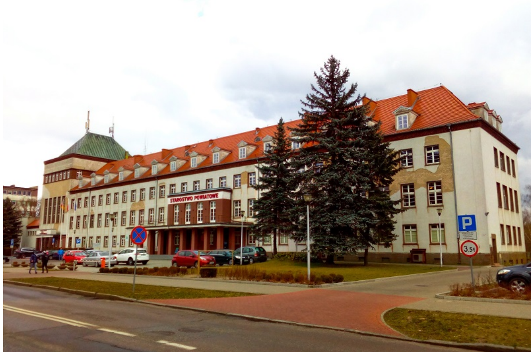
Dom Krajowy. Obecnie siedziba Starostwa Powiatowego w Pile