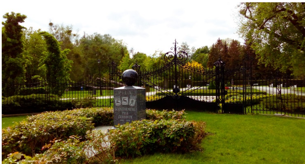
Park Miejski im. Stanisława Staszica. Widok od strony bramy głównej

Już w roku 1895 pilski magistrat zdecydował z kolei o utworzeniu parku miejskiego. Na jego lokalizację wybrano teren przylegający do Parku Strzeleckiego, a prace rozpoczęto w roku 1899. Istniejący już park miejski znacząco powiększono w latach 1927-1929, przyłączając do niego tereny sięgające aż do ulicy Dzieci Polskich. W burzliwym dla dziejów miasta roku 1945 spłonęła parkowa restauracja Kolonade, a po zakończeniu wojny oba parki zostały