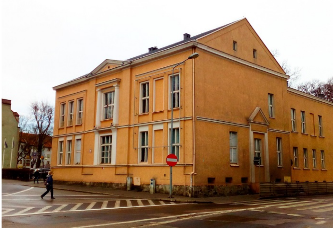
Dawna loża masońska. Obecnie siedziba filii Wyższej Szkoły Gospodarki w Bydgoszczy

wojny mieściła się w nim siedziba Liceum Medycznego, a w czasach późniejszych żłobek. W latach 90-tych w budynku mieściła się Wyższa Szkoła Biznesu w Pile.