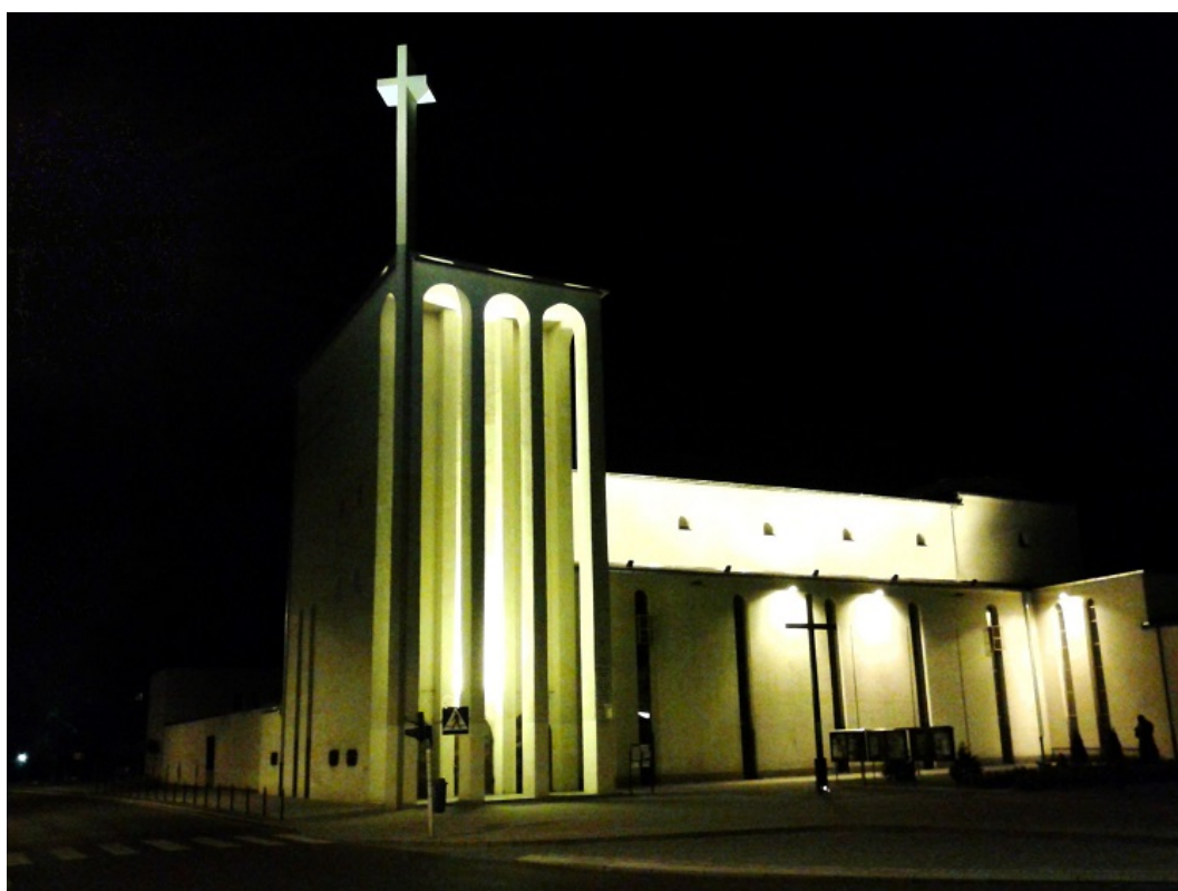
Kościół pw. św. Antoniego o charakterystycznej, modernistycznej architekturze

Kościół, jako świątynia przyklasztorna, posiada kontemplacyjne w wyrazie, katakumbowe wnętrze. Całość zaprojektowano i wybudowano w stylu modernistycznym, charakterystycznym dla lat 20-tych i 30-tych XX wieku. Styl ten w budownictwie sakralnym, zwłaszcza w swojej niemieckiej wersji, częściowo nawiązuje do wczesnego stylu romańskiego ze swoją masywną i uproszczoną formą. Tak jest też w przypadku omawianego obiektu. Warto wspomnieć, że wnętrze budynku zdobi 7-metrowa figura Ukrzyżowanego Chrystusa, wykonana