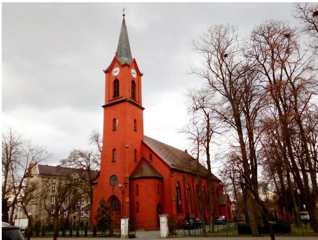
Kościół pw. św. Stanisława Kostki przy ul. Browarnej

w górnej części otworów okiennych mieszczą się witrażowe rozety, zachowane do czasów współczesnych z pierwotnego wystroju świątyni. Prezbiterium przeszklono trzema witrażami, które zaprojektował i wykonał Stanisław Powalisz, znany malarz i witrażysta z I połowy XX wieku. Z pierwotnego wyposażenia kościoła przetrwała do dzisiejszych czasów także mensa ołtarzowa oraz ambona i chrzcielnica. W kościele znajduje się również stworzony w 1948 obraz Matki Boskiej z Dzieciątkiem, autorstwa J. Stankiewicza. Pierwszą poważną renowację kościół przeszedł w roku 1953, jednak już w 1958 roku remont trzeba było powtórzyć.