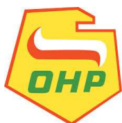
Centrum Edukacji i Pracy Młodzieży OHP w Pile